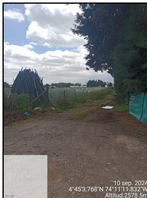
Ilustración 6. Evidencia recorrido, punto 8.