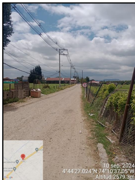
Ilustración 3. Evidencia recorrido, punto 1.

Adicional a ello, en los puntos 1, 6, 7 y 8 no se evidenciaron anomalías que afecten el componente ambiental propio del recorrido de control y vigilancia en la vereda La Isla, como se observa en las siguientes ilustraciones: