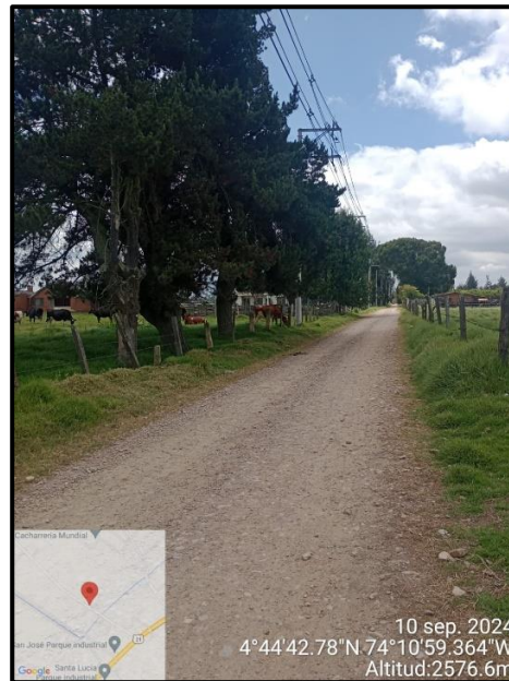
Ilustración 4. Evidencia recorrido, punto 6.