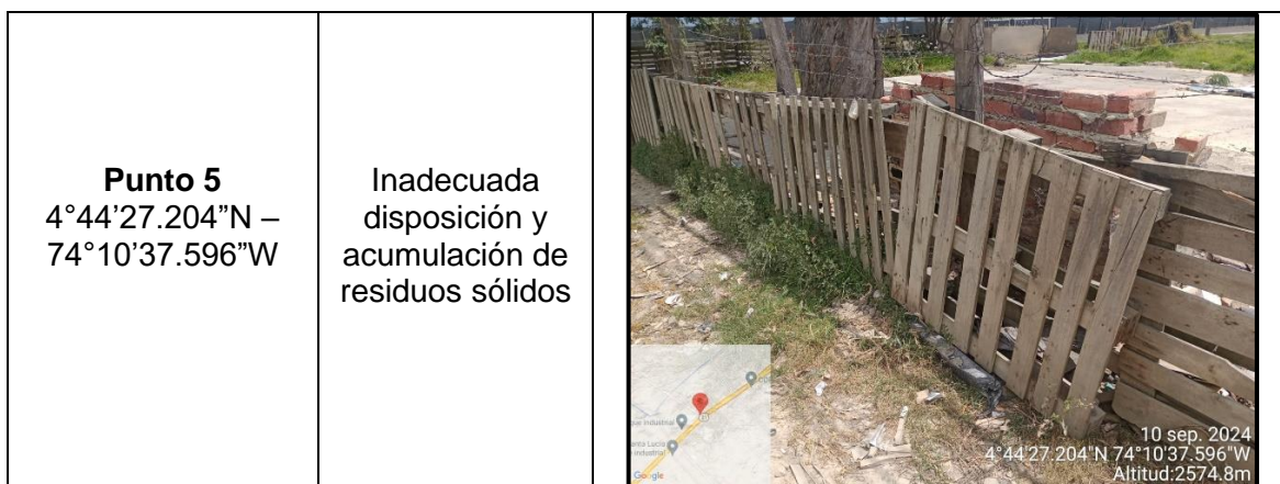
Tabla 1. Hallazgos recorrido de control y vigilancia vereda La Isla.

Adicional a ello, en los puntos 1, 6, 7 y 8 no se evidenciaron anomalías que afecten el componente ambiental propio del recorrido de control y vigilancia en la vereda La Isla, como se observa en las siguientes ilustraciones: