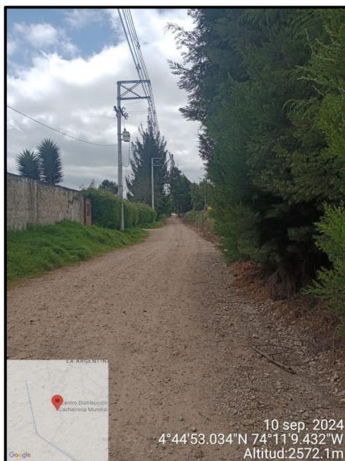
Ilustración 5. Evidencia recorrido, punto 7.

C.P. 250020 Tel. +57(1) 823 40 70 823 40 71 / 823 40 73 Fax. + 57(1) 825 76 20 Dir. Cra. 14 No. 13-05